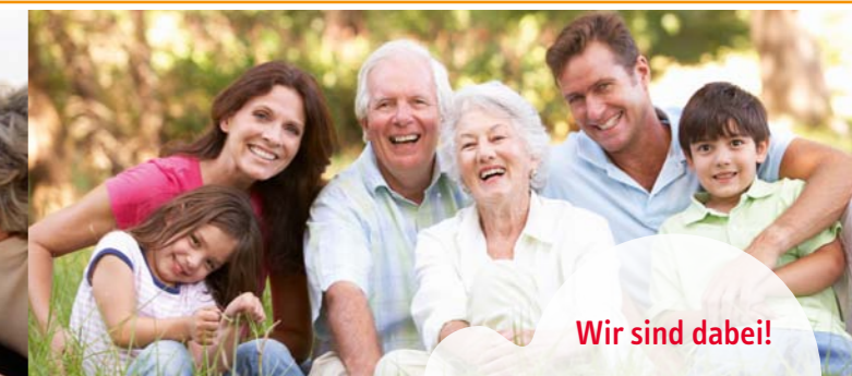
Wir sind dabei!