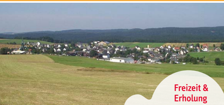
Freizeit & Erholung