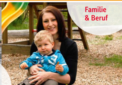
Familie & Beruf